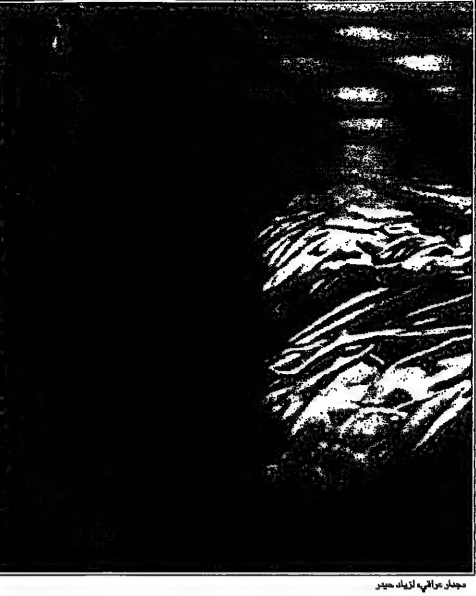
جمال عزيز، الفنان الغريب

هو الفنان الغريب، وهو فنان عراقي له أسلوب فريد في الرسم. بدأ الرسم في سن مبكرة وتلقى تعليمه في المدارس الفنية. اشتهر بآثاره الواقعية التي تتميز بالعمق والواقعية. له أعمال كثيرة في مجال الرسم الزيتي والمزجق. شارك في عدة معارض محلية وعربية. له أسلوب فريد في الرسم، يتميز بالواقعية والعمق. بدأ الرسم في سن مبكرة وتلقى تعليمه في المدارس الفنية.